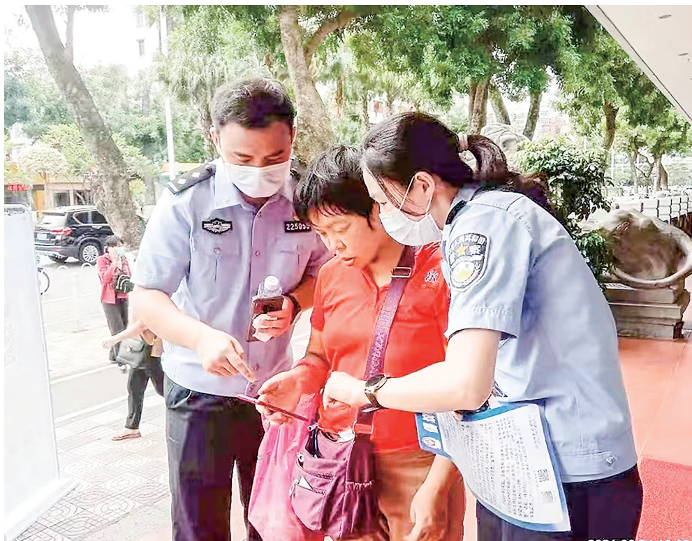
民警上街动员群众安装“国家反诈中心”APP。