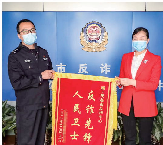
挽回经济损失的事主送锦旗上门。

接到指令后,反诈中心随即对事主进行电话预警,但多次拨打其电话却一直占线。预警民警凭借丰富的工作经验和敏锐的直觉,通过公安大数据平台综合分析,获悉事主已被犯罪分子诱导到电白某酒店。情况紧急,反诈中心民警立即指派辖区派出所,要求第一时间上门实施精准预警劝阻。辖区派出所民警赶到酒店房间时,发现事主仍在房间内与犯罪分子通话,且其名下多张银行卡的资金已经集中转移至同一张卡,正准备按照诈骗分子的指令进行转账操作。最终,在反诈中心及辖区派出所的共同努力下,成功挽回事主经济损失30余万元。