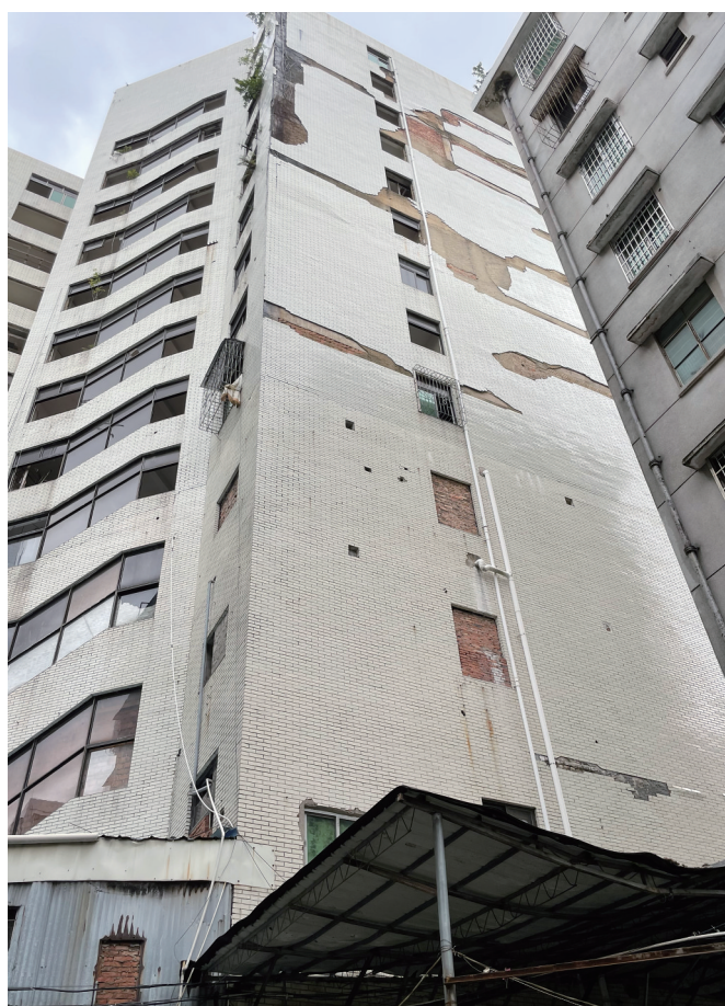
瓷砖脱落的楼栋。