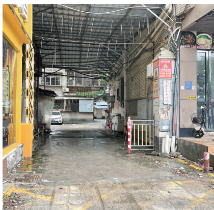
小区正门左右路面还有掉落的零星瓷砖。

茂名晚报讯 记者李君平 7月18日,家住市区双山二路的市民向茂名晚报记者反映,受台风“泰利”影响,紧挨其小区的一栋高楼外墙瓷砖脱落严重,直砸小区内或周边的街上,步步惊心,希望路人注意,也希望相关部门介入处理整改,还大家一个安全出行的环境。