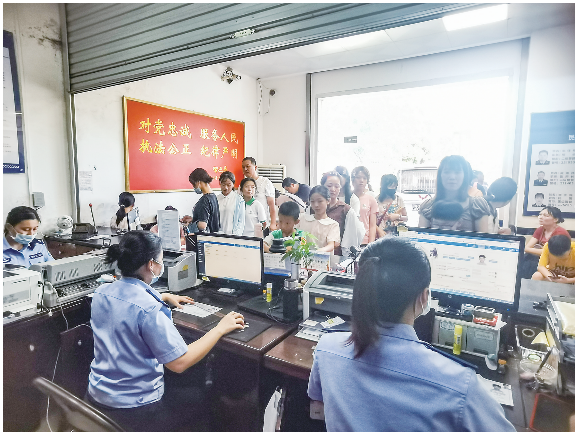
不少家长带着孩子到派出所办理身份证。

也就是说，儿童乘车携带的有效身份证件，满足其中之一即可。但现场多位受访家长表示，感觉出行还是带身份证更方便些。