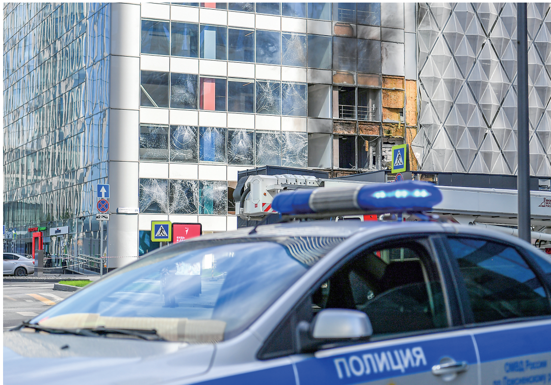
这是7月30日在俄罗斯莫斯科拍摄的被无人机袭击的建筑。俄罗斯国防部30日说,当天挫败了乌克兰方面对莫斯科的无人机袭击。

新华社圣彼得堡7月30日电 俄罗斯总统普京29日晚在圣彼得堡表示,俄罗斯从未拒绝就乌克兰问题进行和平谈判。