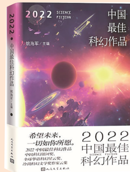
《2022中国最佳科幻作品》 姚海军 著 人民文学出版社

本书从数百篇科幻小说中选出14篇2022年度最优秀的中短篇作品，打造最权威、最具深度和广度的科幻作品年选，呈现2022年整个科幻小说发展的态势。所选篇目想象奇丽，结构紧凑，融清新敏锐和大气凝重于一体，在想象与未来之间创造出科幻创作的多种可能。既有对技术的洞见与期待，也展现了人类的独特感性与美学，同时也有对现实的批判和深刻反思。