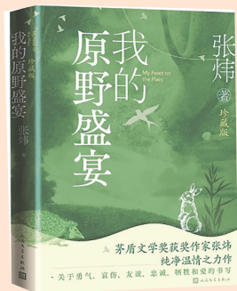
《我的原野盛宴》 张炜 著 人民文学出版社

这是一部纯净唯美、情感浓郁、有着深厚生活积累的非虚构作品。作者以孩童的视角，第一人称的叙述方式，从幼年的童真生活写起，为读者还原了一段被人遗忘的民间历史，精彩地描绘出一场“原野盛宴”。作品生动鲜活地描述了360多种动植物，既有自然世界的丰饶，又有乡间生活的野趣，为我们指引出人生的永恒梦想和生活的至真之乐。