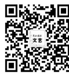
扫码关注，快捷投稿