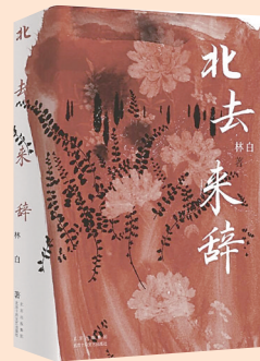
《北去来辞》 林白 著 北京十月文艺出版社

一曲别具一格的“北漂”之歌，一片斑驳陆离的时代足迹，一代又一代难以尽述的生命体悟，汇聚成这部四十余万字的长篇小说。作者以宏阔的格局与独特的视角，鲜活灵动地讲述了两代不同知识层次的女性由南方到北京的坎坷经历与精神成长，并围绕她们，描摹了社会变革大潮冲击下各色人等的悲欢浮沉，展示出中国半个多世纪的社会变迁，也记录了一个时代。