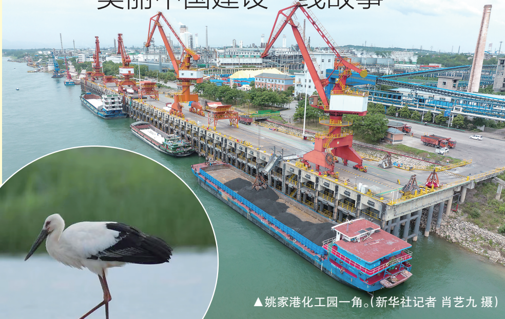
▲姚家港化工园一角。

8月15日,是首个全国生态日。从一江水、一片沙,到一座山、一湾海……美丽中国建设的故事里,尽是万里山河的多姿多彩。