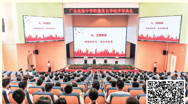
9月5日,广东实验中学附属茂名学校举行首届开学典礼暨义务教育校区启用仪式。