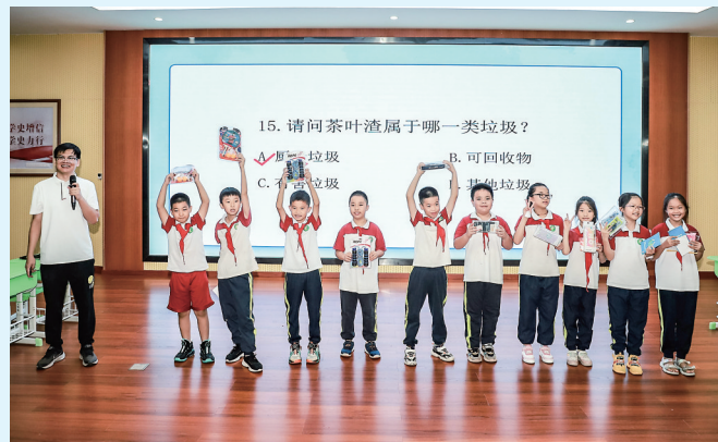
同学们开心领取小礼品。

茂名晚报讯 记者赖碧怡 9月5日上午,由茂名市教育局、茂名市城市管理和综合执法局主办,茂南区城市管理和综合执法局、茂名市愉园小学承办的“生活垃圾分类放,引领校园新风尚”垃圾分类进校园主题宣传活动在愉园小学开展,让垃圾分类教育在校园扎根,进一步加深同学们对垃圾分类的认知,培养良好的垃圾分类习惯。