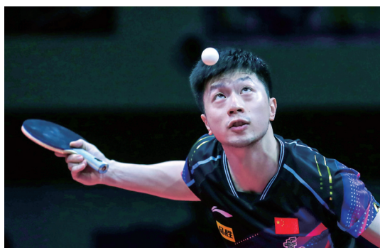
9月10日,马龙在比赛中发球。

12日,杭州亚运会中国体育代表团名单正式公布,886名运动员蓄势待发。马龙等老将再次出征亚运赛场;张雨霏等中坚力量向金牌冲击,为明年的奥运会调整状态;不少亚运新人将在本土迎来自己运动生涯的里程碑时刻。