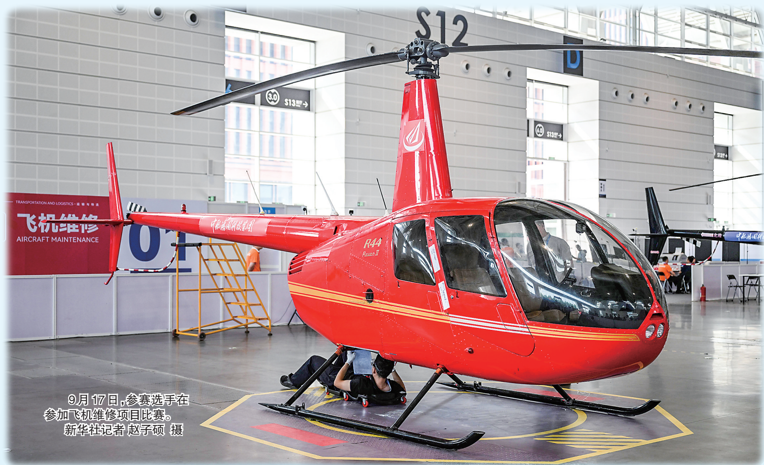
9月17日,参赛选手在参加飞机维修项目比赛。