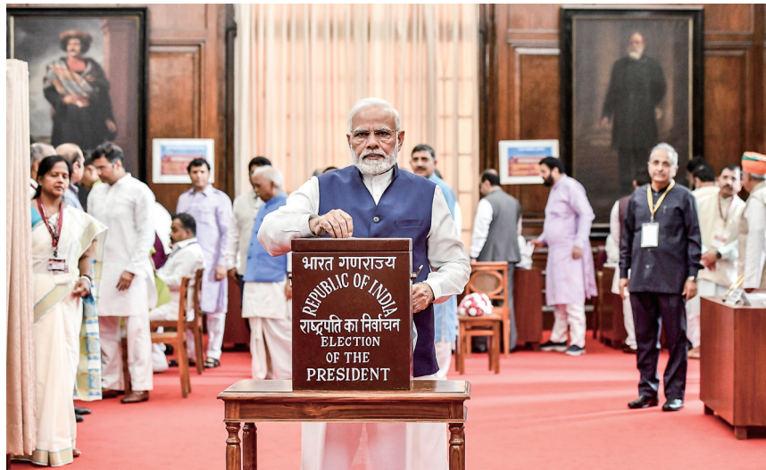
2022年7月18日,印度总理莫迪在新德里参加总统选举投票。

加拿大与印度多年来在锡克教徒反印抗议活动这一问题上矛盾不断。2020年,旁遮普邦等多地农民大规模抗议政府推行的农业改革,其中不少人是锡克教徒。特鲁多参加国内印度裔锡克教徒活动时对上述抗议活动表