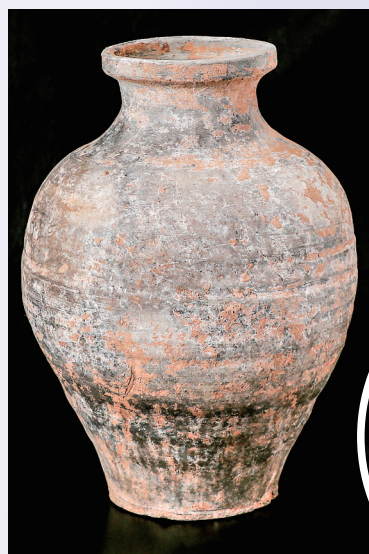
◀这是北周宇文觉墓出土的陶罐(资料照片)。