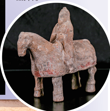
▼这是北周宇文觉墓出土的甲骑具装俑(资料照片)。