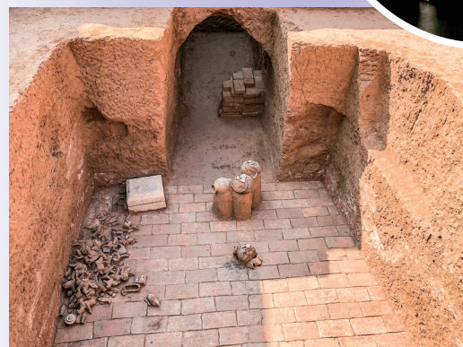
◀这是北周宇文觉墓的墓室(资料照片)。

新华社西安9月19日电(记者杨一苗)记者19日从陕西省考古研究院了解到,考古工作者在陕西省咸阳市发现了北周开国皇帝宇文觉墓,出土陶俑等随葬遗物146件(组)。