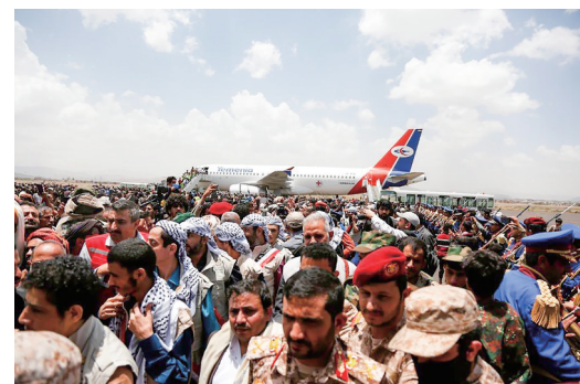
4月14日,在也门萨那机场,人们迎接获释的胡塞武装成员战俘。

今年以来,随着沙特与伊朗实现关系正常化,也门停火相关谈判也不断取得积极进展。4月,在阿曼方面斡旋下,沙特代表在萨那与胡塞武装高层会面,为实现停火、结束敌对进行对话。(刘江)