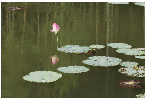
仲夏荷塘 ■ 丁宁