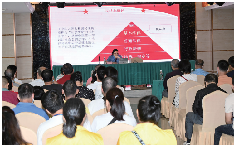
视障人士听普法讲座。

活动中,市残联相关负责人鼓励广大残疾人朋友们继续发扬自强不息、顽强拼搏的精神,无论在生活中还是在工作上,都要自尊、自信、自强、自立,用行动追求梦想,助力我市残疾人事业高质量发展,为我市经济发展作出更大贡献。