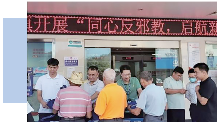
派发宣传单和宣传袋。

茂名晚报讯 记者柯泽彪 通讯员黄培劲 为切实做好辖区的反邪宣传工作,让反邪知识深入人心。日前,信宜市平塘镇政府联合派出所、司法所,以群众为载体开展反邪教主题宣传周活动。