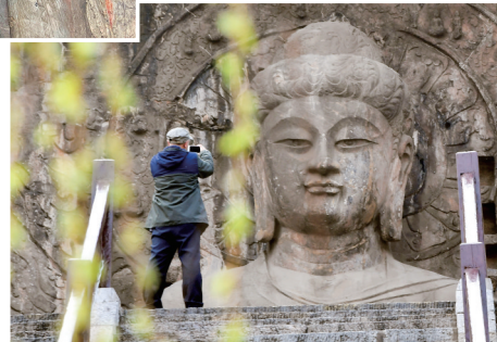
◀游客在龙门石窟参观游览。

洛阳南郊,两山对峙,伊水中流。2345个窟龕、近11万尊佛像、2800多块碑刻题记、近80座佛塔,蜂房燕窝般镶嵌在东西两侧的香山和龙门山上,巍峨壮观。这就是龙门石窟。