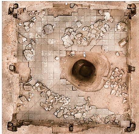
这是甘肃礼县四角坪遗址中部夯土台基中心的半地穴空间及甘肃考古工作者绘制的复原图。