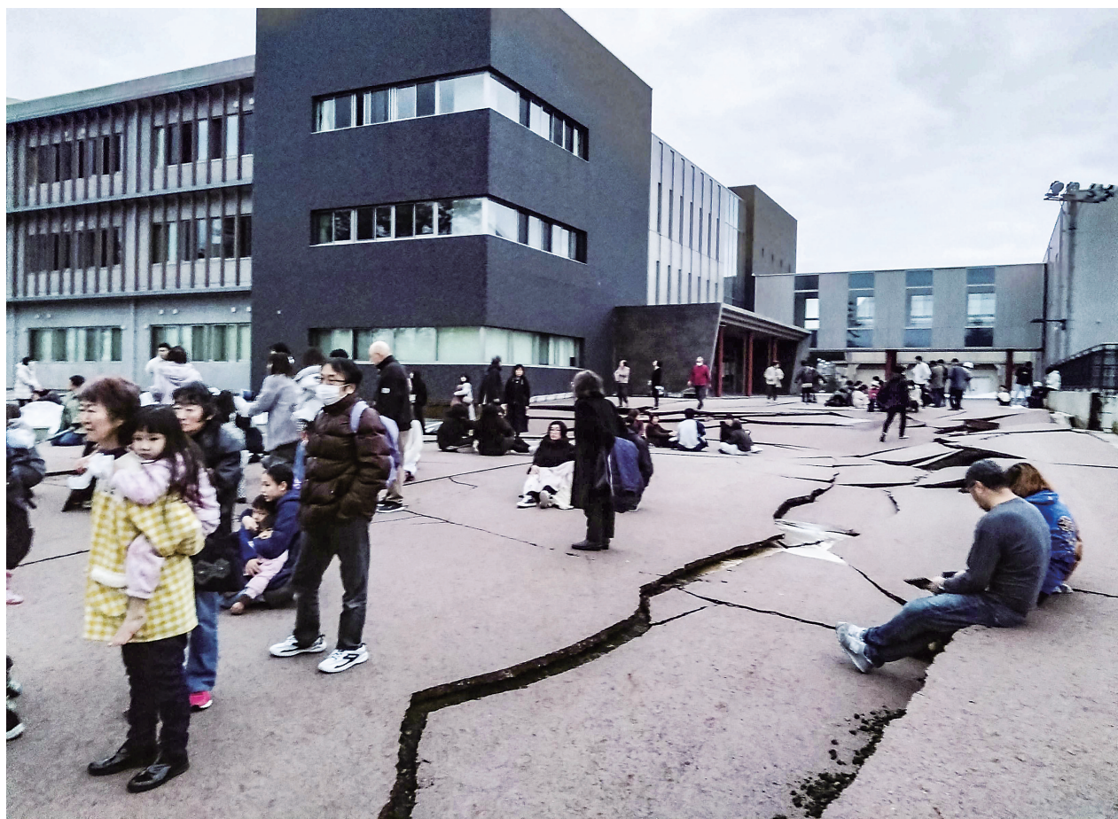
1月1日,在日本石川县轮岛市,人们站在被地震破坏的地面上。