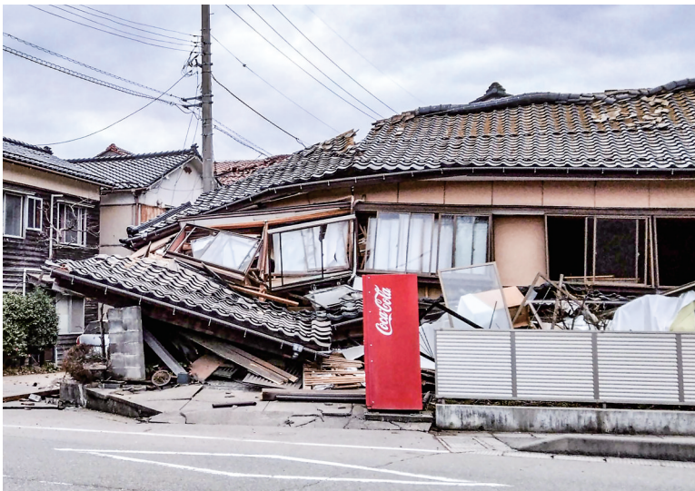
◀这是1月1日在日本石川县轮岛市河井町拍摄的受损房屋。