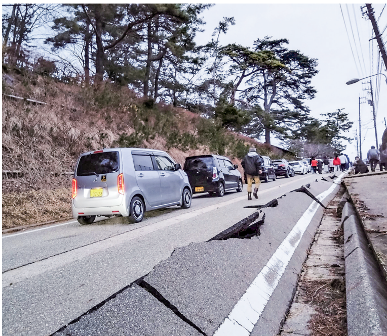
这是1月1日在日本石川县轮岛市河井町拍摄的受损道路。