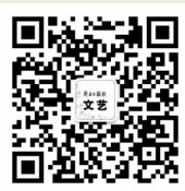
快捷投稿 扫码关注