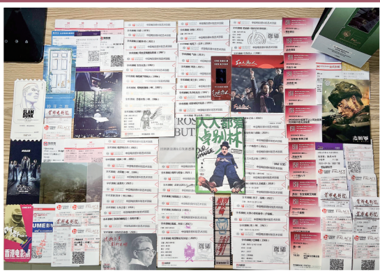
孙女士收集的2023年所看电影票票根。