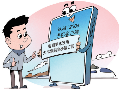
购票方便快捷 新华社发 勾建山 作

这位负责人表示,铁路12306推出两项新功能后,将进一步提升购票体验,更好地维护公平公正的购票环境,欢迎广大旅客使用。