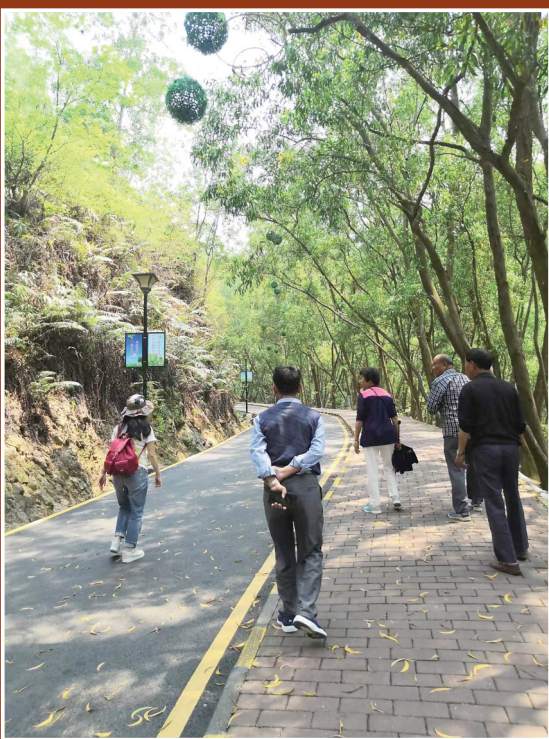
自然景观吸引游客打卡观赏。