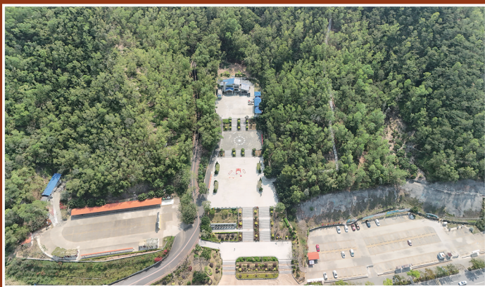
笔架山森林公园半入口。