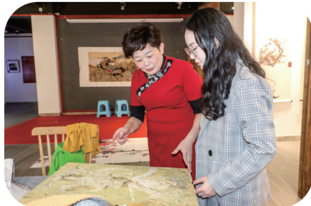
介绍工笔创作历程。