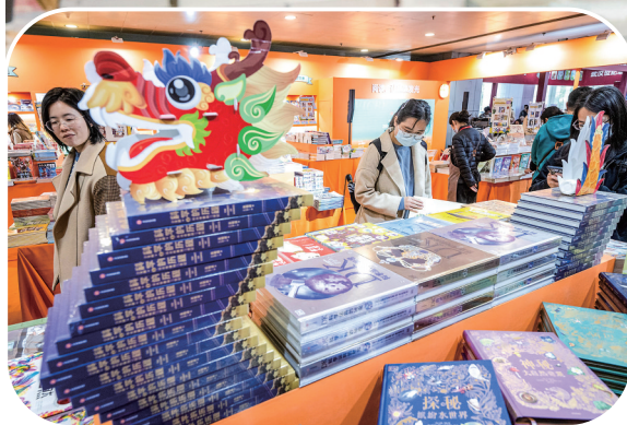
◀读者在中信童书展位选购书籍。