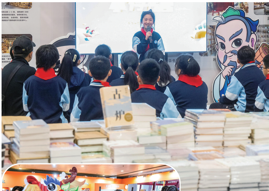
▲小学生在2024武汉(国际)童书展现场分享喜欢的图书。