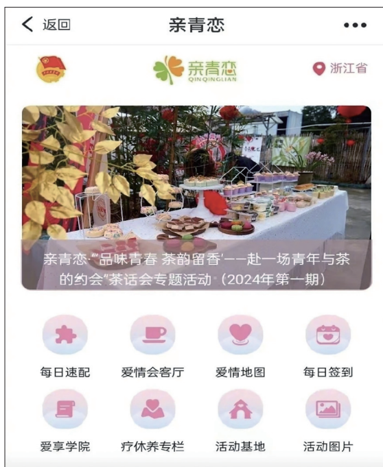
图为“亲青恋”平台页面截图。

实会员婚姻登记情况,向教育部门获取学历教育信息,向人社部门查证社保缴纳记录等,通过大数据核查,第一时间进行信息认证,并保护大家的隐私,兼顾了信息的真实性和安全性。目前,浙江省外用户的大数据还未打通,省外用户只能注册为普通会员,无法完成认证。