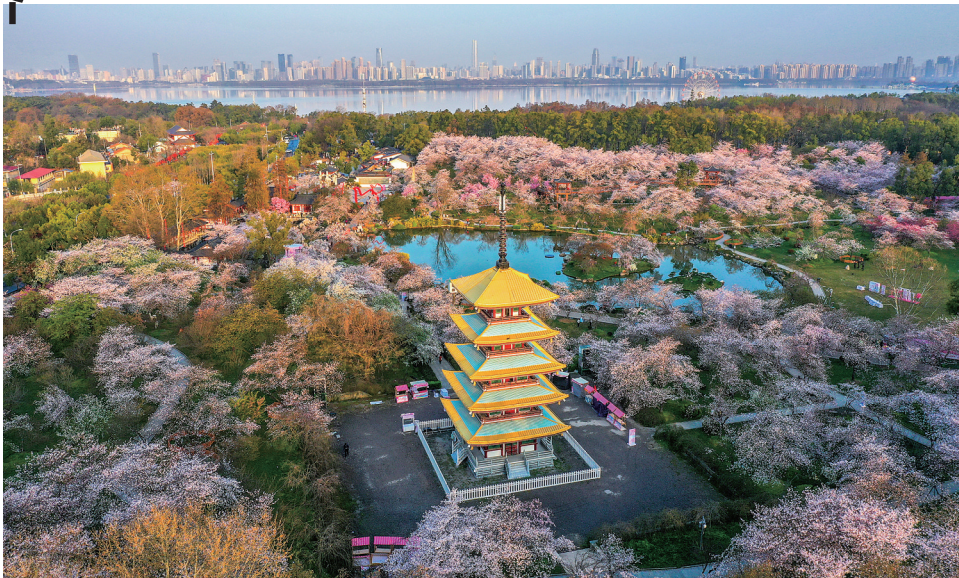
3月22日在湖北武汉东湖风景区拍摄的樱花。