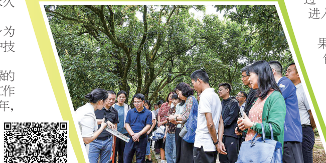
荔枝种植园每天都吸引众多市民游客前来参观。