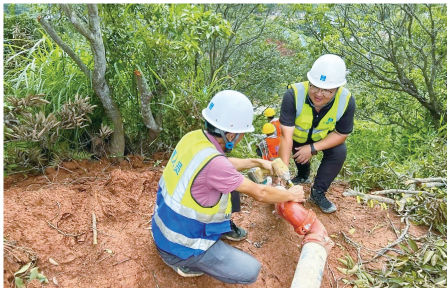
▲高州市城乡集中供水项目施工工地。