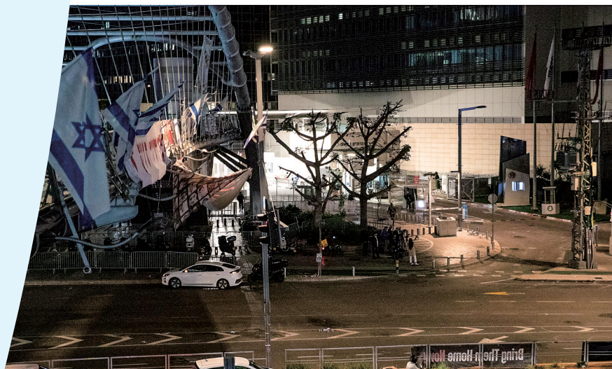
上图:4月13日晚,在以色列特拉维夫的以色列国防部前,民众在安全警告生效前举行示威集会;下图:4月13日晚,在以色列特拉维夫的以色列国防部前参加示威集会的民众在安全警告生效后散去。