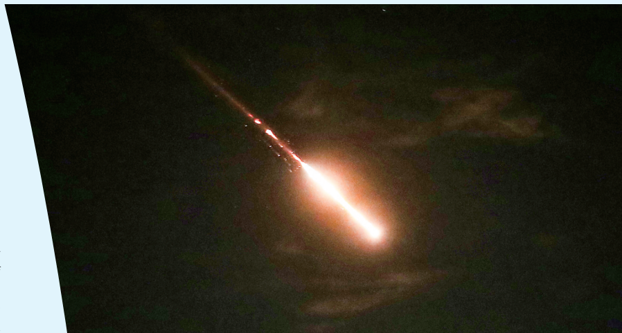
这是4月14日凌晨在耶路撒冷上空拍摄的以色列“铁穹”防空系统启动拦截的画面。