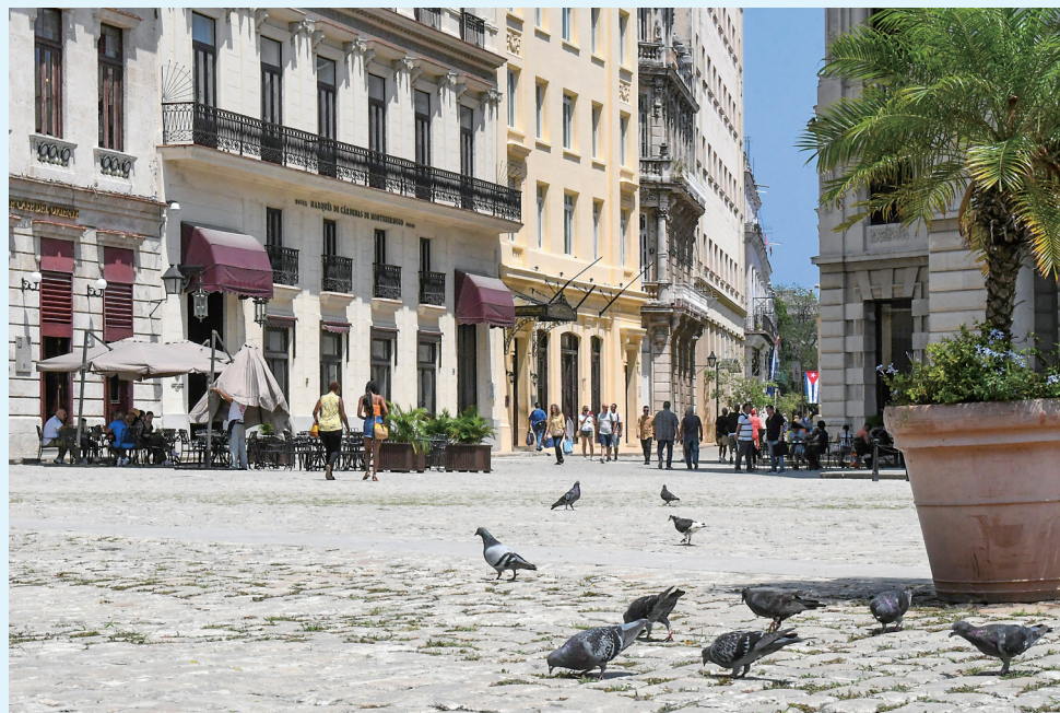
2023年5月4日,鸽子在古巴哈瓦那旧城一处广场觅食。

新华社北京4月16日电 美国与古巴定于16日在美国首都华盛顿举行新一轮移民会谈。古巴官员15日再次呼吁美国放松制裁,称美方制裁是移民问题的根源。