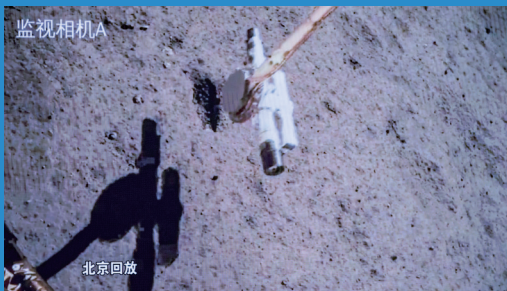
6月4日在北京航天飞行控制中心屏幕上拍摄的嫦娥六号取样回放画面。