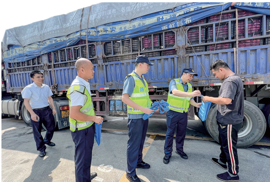
包茂、茂湛高速路政人员深入沿线运输企业,向大货车司机宣传大件运输管理要求。