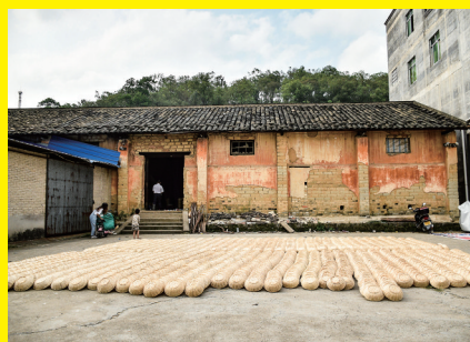
▲立石驿(掘洞驿)遗址