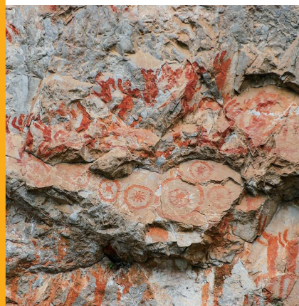
岩画一景,七面铜鼓排列有序,类似中原编钟之组合。