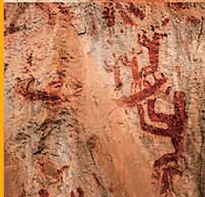
岩画中的部分图案,自上而下分别为:侧身女性图像,梳着辫子,腹部隆起,似怀孕状;铜鼓在上,人侧身在下,举双手作敲击铜鼓状;正身女性人像,腰配长剑,手持一球状物;局部船形图像,船两端上翘,船头似鸟形,船上站数人,侧身,作舞蹈状(拼版照片)。