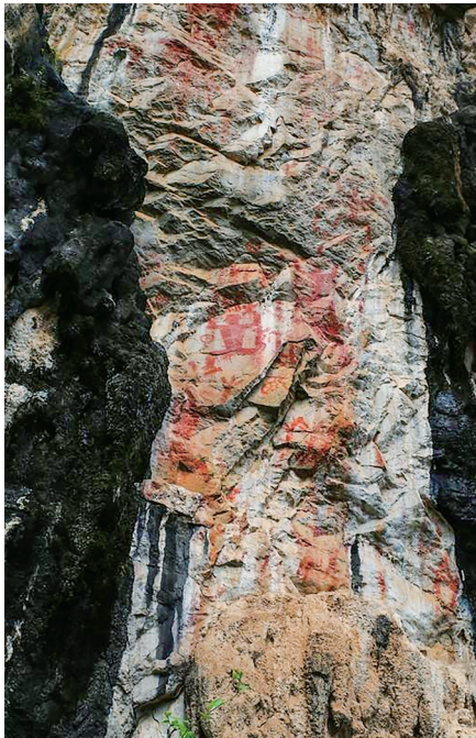
崖壁上的花山岩画一景,悬崖呈现出不同颜色的岩石。