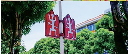
宁明县城随处可见的花山岩画元素(拼版照片)。