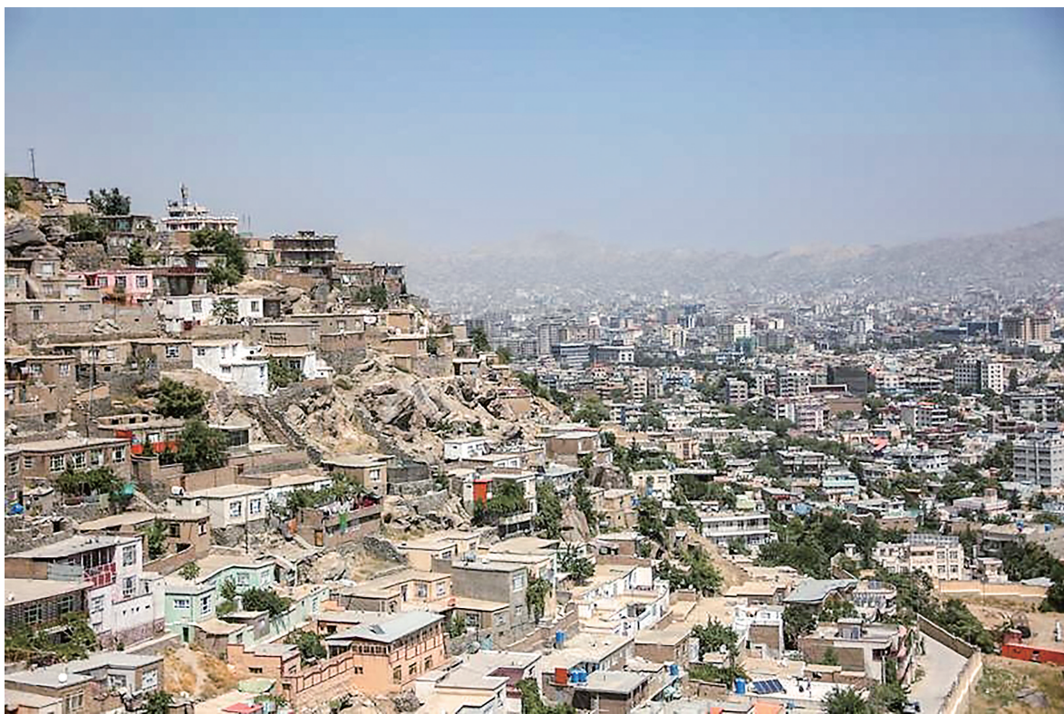
这是8月14日拍摄的阿富汗首都喀布尔。

据澳大利亚智库经济与和平研究所发布的《2024版全球恐怖主义指数报告》,2023年阿安全形势得到改善,自2019年以来首次不再是全球恐怖主义指数排名第一的国家。