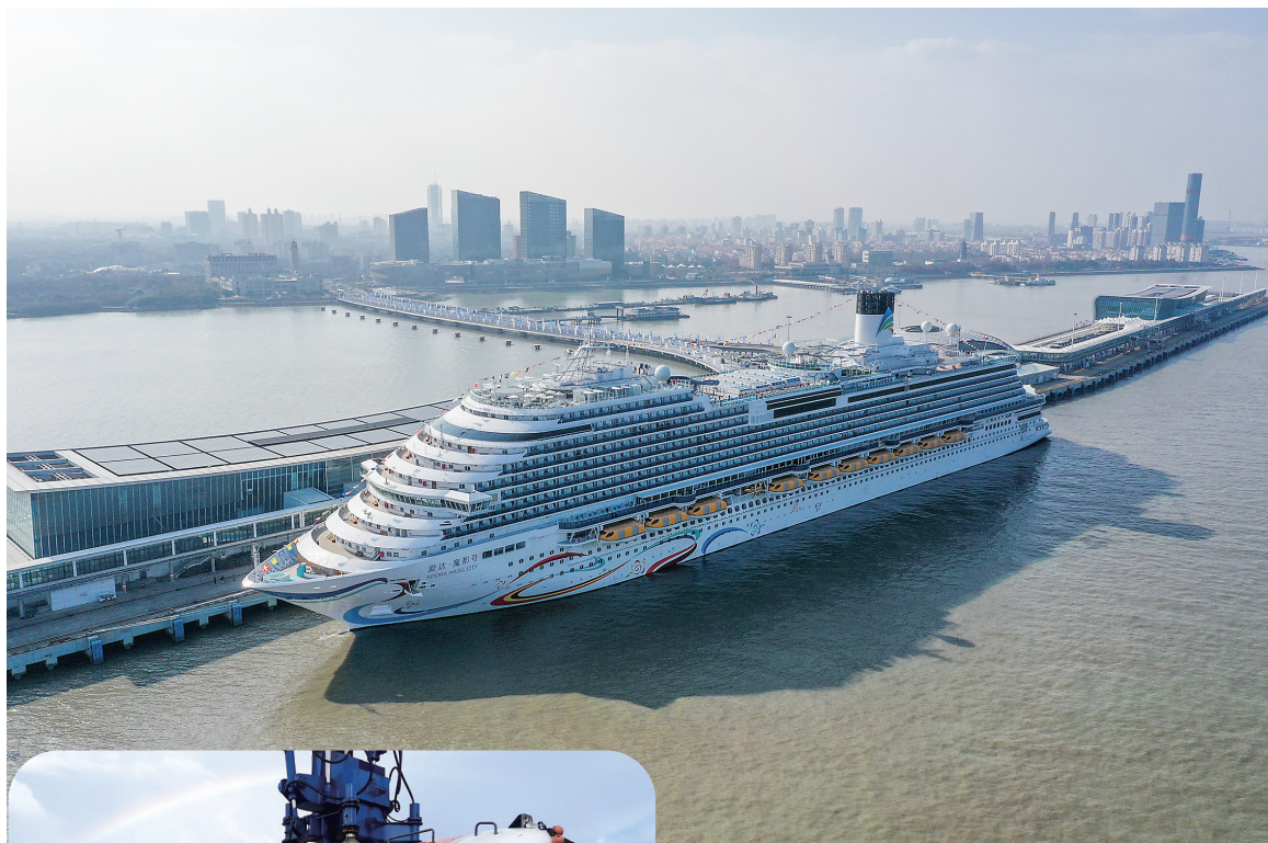
▲国产首艘大型邮轮“爱达·魔都号”停靠在上海吴淞口国际邮轮港(2024年1月1日摄,无人机照片)。