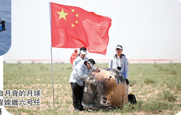
▶6月25日14时7分,嫦娥六号返回器携带来自月背的月球样品安全着陆在内蒙古四子王旗预定区域,探月工程嫦娥六号任务取得圆满成功。

航提供全球精准服务,国产大飞机实现商飞,新能源汽车为全球汽车产业增添新动力。2013年至2023年,我国规模以上装备制造业、高技术制造业增加值年均分别增长8.7%、10.3%,战略性新兴产业发展壮大,成为引领高质量发展的重要引擎。