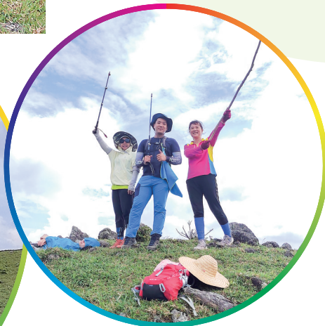
▲登上山顶,与天空合影。