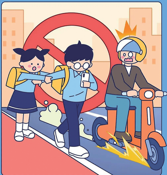
公安部交通管理局 教育部基础教育司