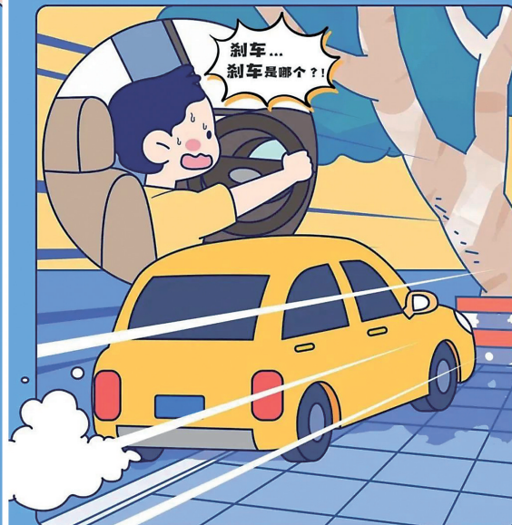
公安部交通管理局 教育部基础教育司