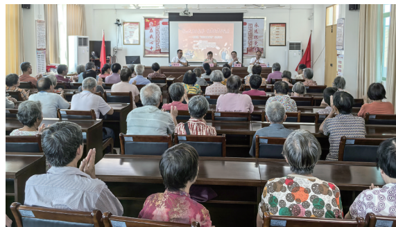
活动现场。

实实在在的好事。“老人摔倒的现象时有发生,一旦发生意外,医疗费是一笔不小的支出,如今有了这份保障,我们也更放心了。”该社区居民谭伯说。