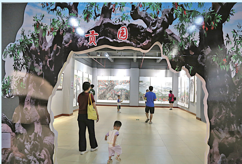
10月1日,市民在茂名市博物馆参观《天生“荔”质——荔枝文化主题展》。