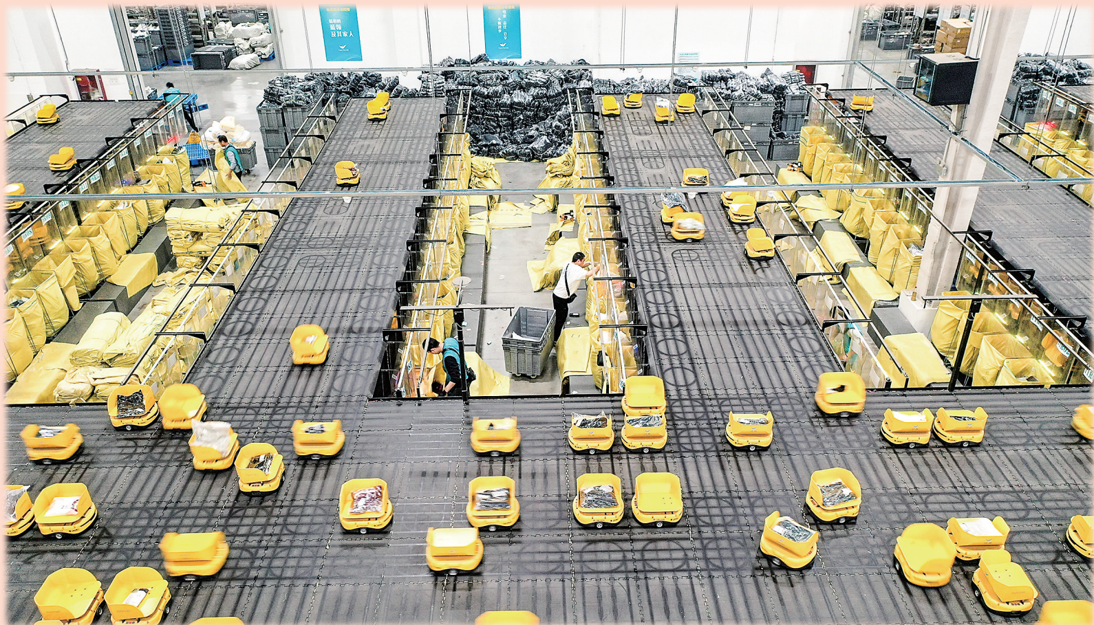
11月7日,浙江省湖州市德清县乾元镇第一产业智慧物流园区快鱼服饰有限公司华东物流中心,800余台分拣“小黄人”机器人在精准配送各类服饰(无人机照片)。

新华社北京11月11日电(记者邵鲁文、李明辉、王雨萧)“双11”16年了。这一见证电商行业飞速发展的“购物节”,已成为影响力极广的消费盛事。