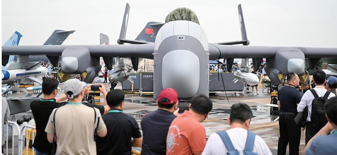
▼这是11月13日拍摄的“九天”无人机系统。