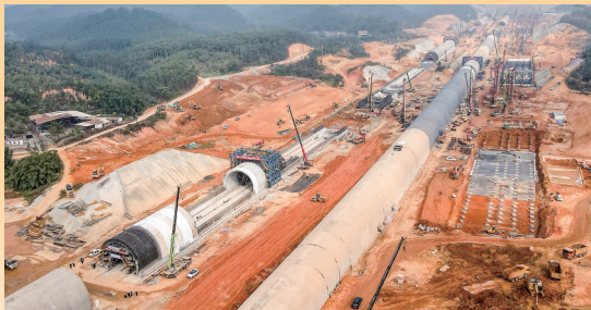
12月10日拍摄的深南高铁广东段的机场隧道工地施工现场(无人机照片)。

仲冬时节,贵州安顺,贵州黄桶至广西百色铁路喜明隧道建设现场机械轰鸣,200多名来自中铁二十三局的建设者穿梭忙碌。全长4543米的喜明隧道地处苗岭山区,地质条件复杂,是黄百铁路贵州段重难点工程。建成通车后,黄百铁路作为西部陆海新通道标志性工程,将进一步完善区域铁路网布局。