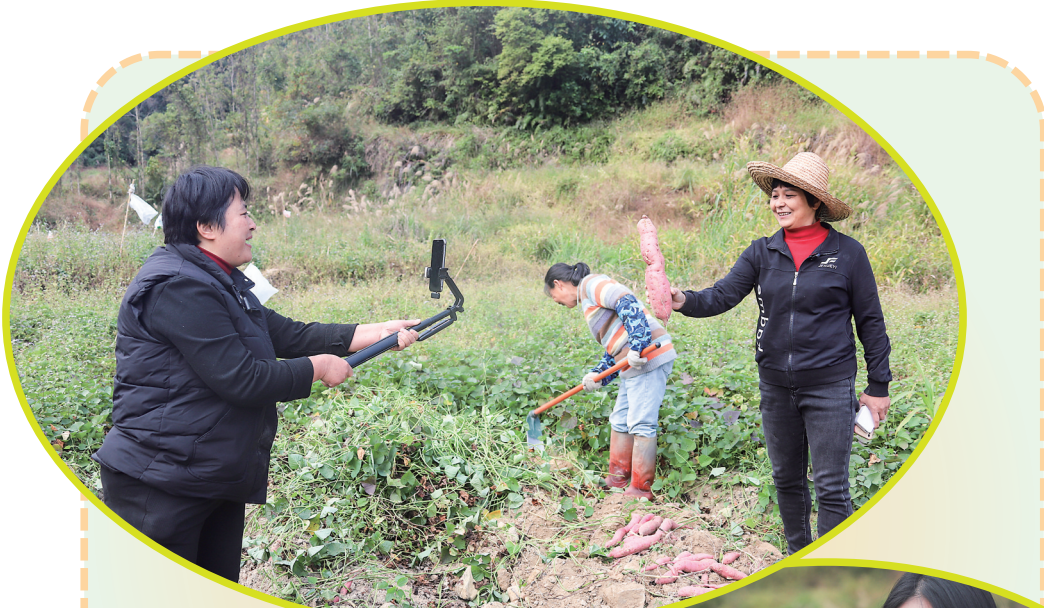
▲村民展示刚收获的香薯。

现场除了香薯试吃,村民还请来抖音等平台的主播们进行直播带货。主播们手捧着板栗香薯,对着镜头全方位展示:“家人们,看这香薯,表皮带天然质朴。这都是排田村的优质出品,这里的自然环境得天独厚,远离城市喧嚣与污染……”“咱们这板栗香薯啊,产自排田村,这里青山环绕,绿水长流。在这片净土上种出来的香薯,初尝是香薯的绵密软糯、甜香爽口,紧接着,