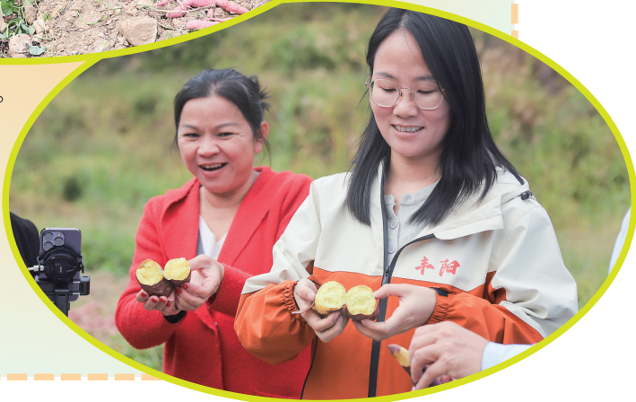
▶展示在田头烤熟的香薯。

板栗的香甜风味瞬间弥漫整个口腔,那浓郁的甘甜与独特的栗香相互交织,既有着香薯的醇厚,又有着板栗的清爽,吞之下肚后,那股香甜还在舌尖和喉咙处悠悠萦绕,让您回味无穷。”他们绘声绘色地讲述着香薯背后的故事,屏幕那头的观众热情高涨,订单不断。