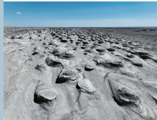
在海西蒙古族藏族自治州茫崖市冷湖镇境内拍摄的黑独山一角(无人机照片)。