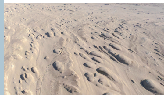
茫崖俄博梁雅丹地貌宛如火星表面(无人机照片)。