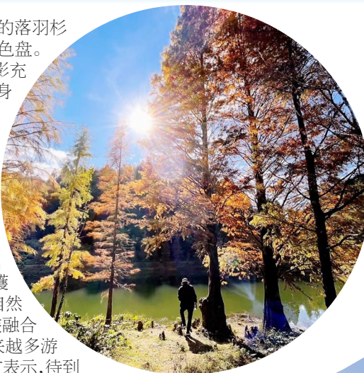
美丽的鹿湖顶景色。

今年,石钹坳和鹿湖顶景点同期“火出圈”,点燃了“中国李乡”钱排镇的冬季旅游热潮。据了解,进入11月以来,钱排旅游业比往年同期明显升温,每天入境游客络绎不绝,“山水双合”“李花谷”等农文旅景区备受游客青睐,为当地餐饮、住宿等行业带来了显著的客流增长。“钱排游以往的热点是‘春花夏果’,今年石钹坳、鹿湖顶冬季游出圈,彰显了钱排镇自然风光、气候独特等资源优势。随着农文旅融合深度发展,相信‘中国李乡’将会成为越来越多游客向往的旅游目的地。”钱排镇镇长李先友表示,待到冬末春初,李乡又将迎来十万亩李花迎春怒放的醉美“香雪”盛景,热诚欢迎各地游客前来李乡游玩观光!