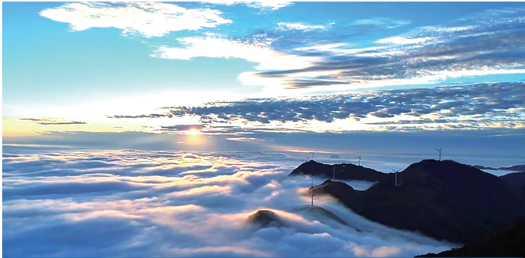
云海奇观,令人心驰神往。