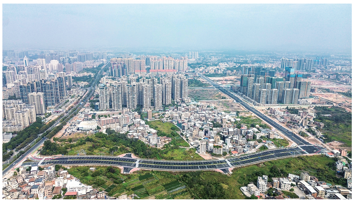
文才路(下)连通东粤路(右)与茂名大道(左)。

意到，文才路的绿化种植、交通灯安装和路面标线等工作已基本完成，人行道也已基本完工。东粤路南段则有工人和机械在加快铺设人行道、种植绿化树、清理路面垃圾等。“真是太好了，以后到万达广场和东荟城方便多了，不用走正在施工的茂名大道了。”一名家住附近的市民高兴地说道。 “这两条道路通车后，不仅让茂东片区再向东向南拓展城市版图，还进一步优化了城市路网，有效分流茂名大道和油城十路交通压力，疏通城区交通经脉，给居民出行带来极大的便利。同时，对茂名城镇化进程和产业发展也起到积极的促进作用。”市发展集团有关人员表示。