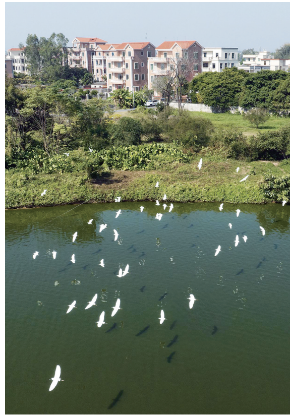
成立京塘农业有限公司,投资10亿元,打造高质发展育苗、养殖、生产的罗非鱼产业链,壮大当地的罗非鱼产业。