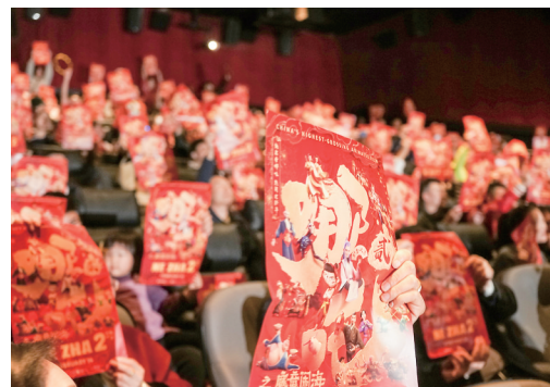
2月8日,人们在美国洛杉矶举行的《哪吒之魔童闹海》北美首映礼上举起电影海报。

新华社洛杉矶2月14日电(记者高山 谭晶晶)不断刷新票房纪录的中国动画电影《哪吒之魔童闹海》(简称《哪吒2》)14日正式在北美地区上映,仅预售票房就超过近20年华语片首周末票房纪录。