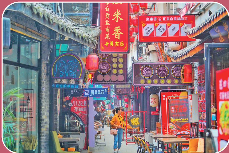
改造后的成都猛追湾片区。