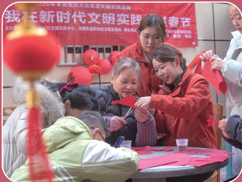
1月27日,在湖北省宜昌市西陵区安居小区党群连心站,居民与改造此小区的建设者们欢聚在一起,开展写春联福字、剪窗花等活动,在喜气祥和的气氛中迎接即将到来的春节。