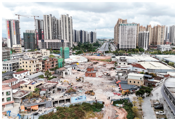
建设中的官山六路。