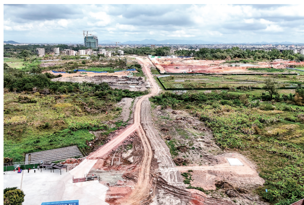
建设中的文才东路。