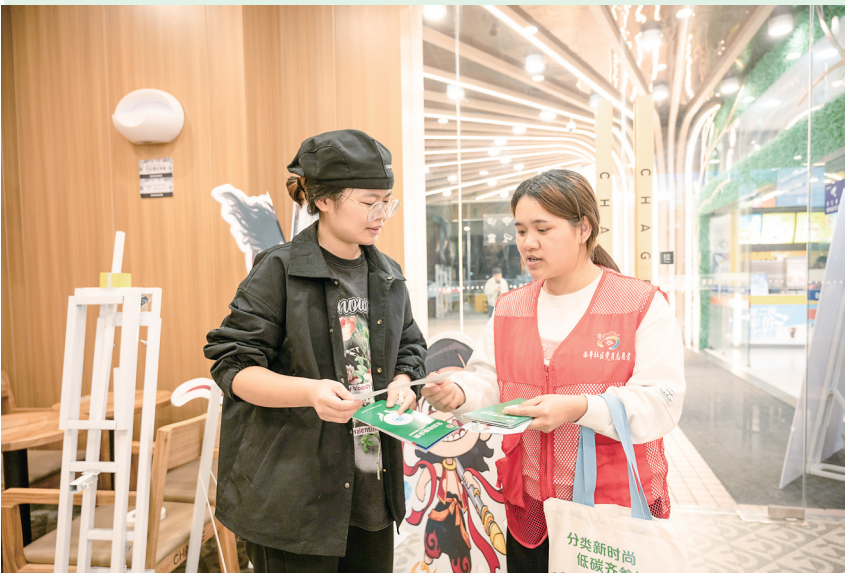
志愿者向餐饮商户普及生活垃圾分类知识。

茂名晚报讯 记者 和沛蓉 通讯员 林文杰 黄文静 近日,茂名市城管执法局、茂南区城管执法局、茂南区河东街道办事处及西粤社区居委会等四级党组织联动,组织党员干部、志愿者走进商超,开展“垃圾分类共参与 分类责任我落实”主题普法宣传活动,通过多级联动、政企协同、互动体验,推动生活垃圾分类从“新风尚”转变为“新日常”,引导市民群众养成分类的生活习惯。